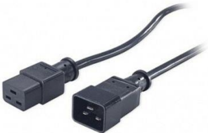
Кабель электропитания TLK-PCM16